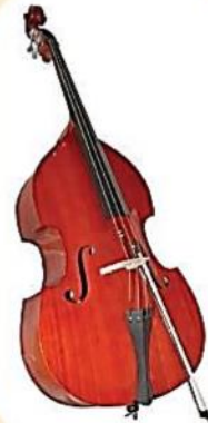
ดับเบิลเบส