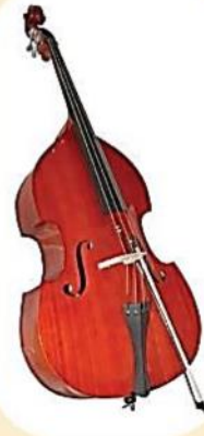
ดับเบิลเบส