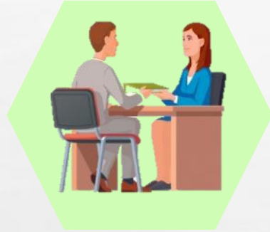
รับผิดชอบ