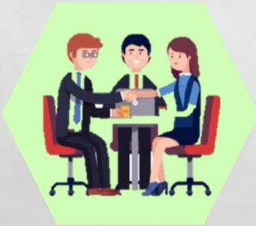
ให้ความร่วมมือ