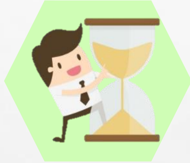
ตรงต่อเวลา