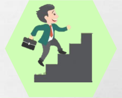
มุ่งมั่นตั้งใจ