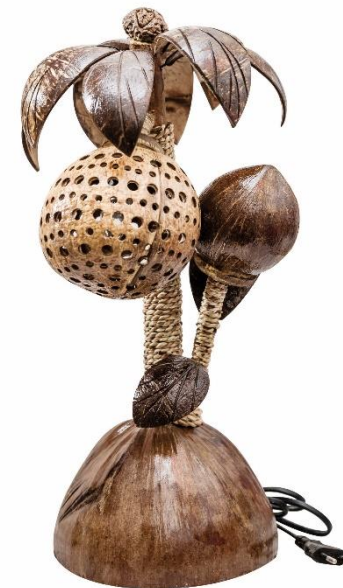
โคมไฟจากกะลามะพร้าว