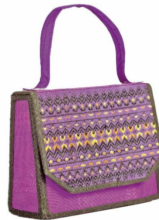
กระเป๋าจากผ้าทอพื้นเมือง