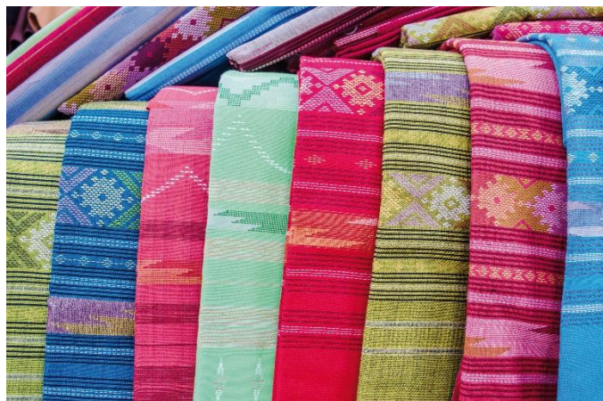
ผ้าทอพื้นเมือง