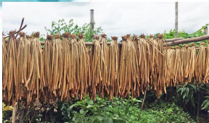
ผักตบชวา