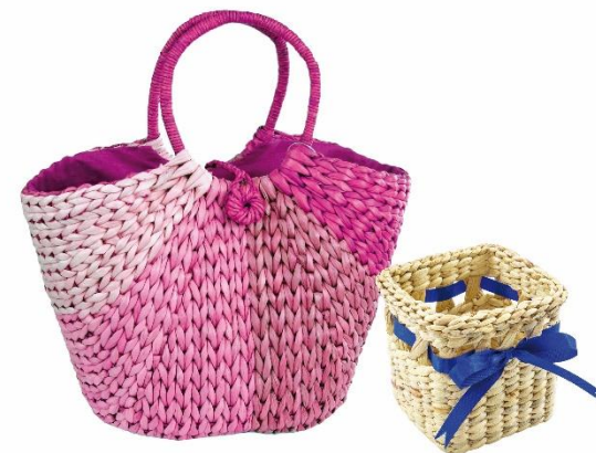
กระเป๋าและตะกร้าสานจากผักตบชวา