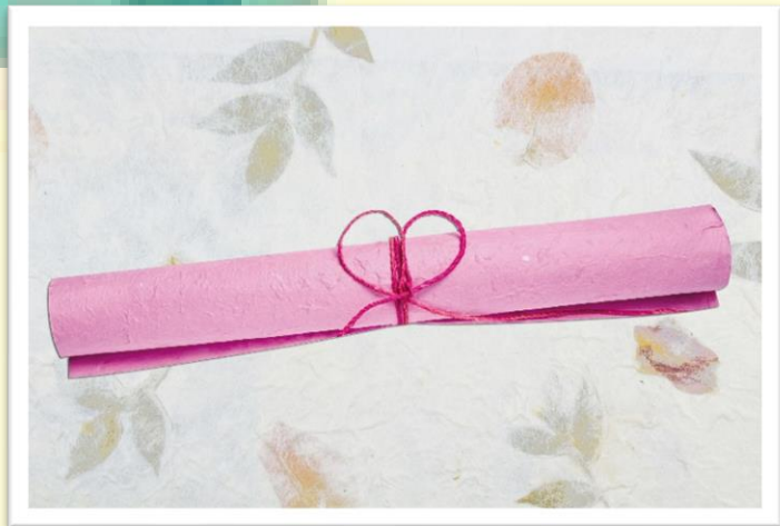
กระดาษชนิดต่าง ๆ