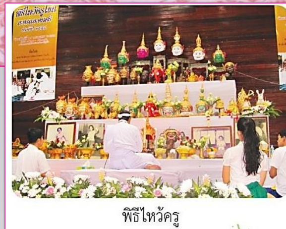
พิธีไหว้ครู

ความจำทำทางในการรำ จังหวะดนตรี ผู้เรียนนาฏศิลป์ ทุกคนถือว่าพิธี ครอบครูเป็นพิธีสำคัญและจำเป็น สำหรับผู้ปฏิบัติทำรำในระดับสูง