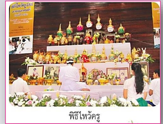
พิธีไหว้ครู

๔) พิธีมอบ พิธีนี้เป็นขั้นตอนที่สูงที่สุด คือ การได้รับมอบความรู้ ความเป็นครู ในพิธีมอบครูจะนำอาวุธในการแสดงทั้งหมดมัดรวมกัน และภาวนาคาถาให้ศิษย์น้อมรับ พิธีนี้เป็นประเพณีนิยมที่ปฏิบัติกันมาจนถึงปัจจุบัน