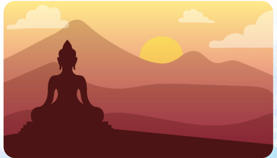
ข้อคิดและคติทางธรรม